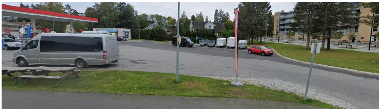
Foto fra Google Street View, med omsøkt plassering av telt og container på parkeringsplass til høyre i bildet.